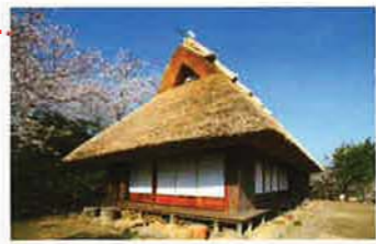
旧味元家住宅主屋1棟 (移築された山村民家) (登録有形文化財・ 平成12年4月28日登録)