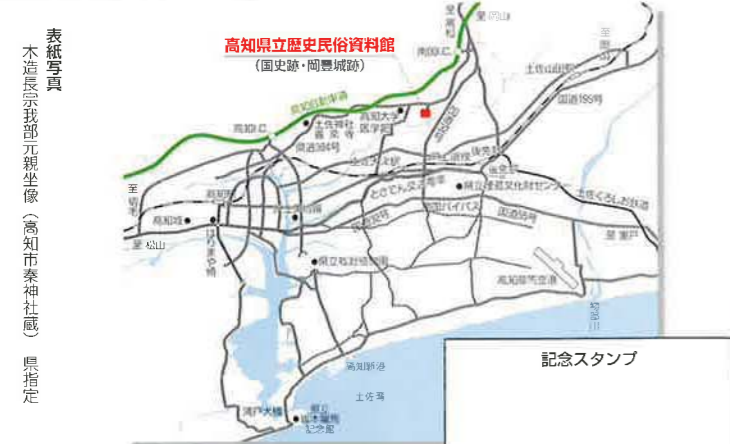
表紙写真 木造長宗我部元親坐像(高知市秦神社蔵) 県指定

高知県立歴史民俗資料館 KOCHI PREFECTURAL MUSEUM OF HISTORY 〒783-0044 南国市岡豊町八幡1099-1 Tel.(088)862-2211 Fax.(088)862-2110 http://www.kochi-bunkazaidan.or.jp/rekimin/ E-mail: rekimin@kochi-bunkazaidan.or.jp