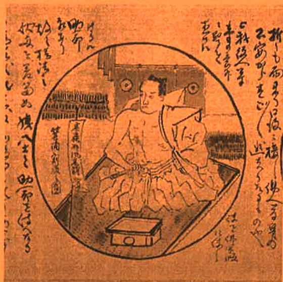
箕浦割腹之図『堺妙国寺十一烈士銘々図伝』(当館蔵)