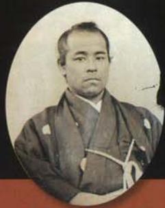
後藤象二郎湿板写真