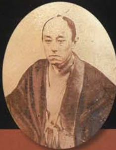
山内容堂湿板写真 (館蔵)