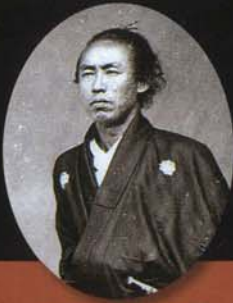
坂本龍馬湿板写真