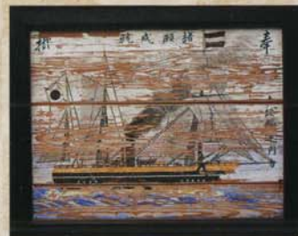
夕顔艦絵馬 (仁井田神社蔵・展示は8月31日まで)