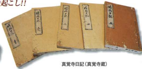
真覚寺日記(真覚寺蔵)