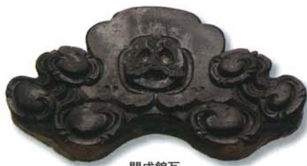
開成館瓦 (高知県立高知小津高等学校蔵)