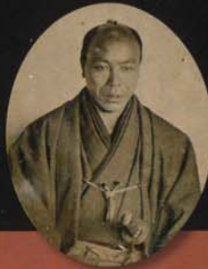
吉田東洋湿板写真