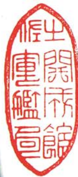
開成館蔵書印 (高知県立高知追手前高等学校蔵本より)